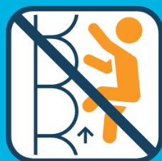
Niet op zijwanden klimmen