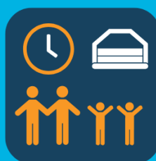
Grote en kleine kinderen wisselen af