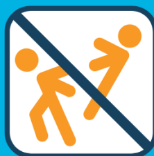
Niet duiken of wild spelen