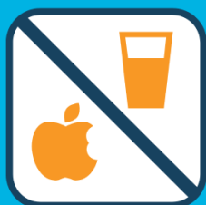
Geen eten of drinken