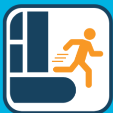
Afstapje snel verlaten