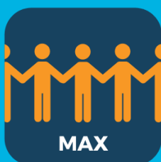
Check maximale aantal personen