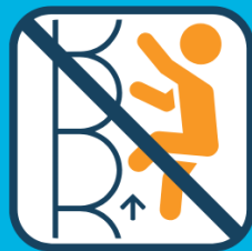
Niet op zijwanden klimmen