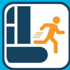
Afstapje snel verlaten