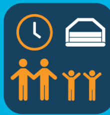
Grote en kleine kinderen wisselen af